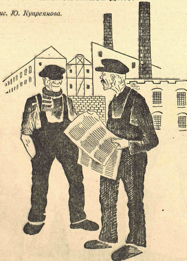
Рис. Ю. Купреянова.

В Минске демонстрация чуть-чуть не проломила камнем голову польскому консулу. Представитель Наркоминдела выразил сожаление.