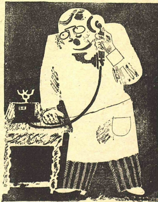
— Что же вы не дышите? Дышите глубже!