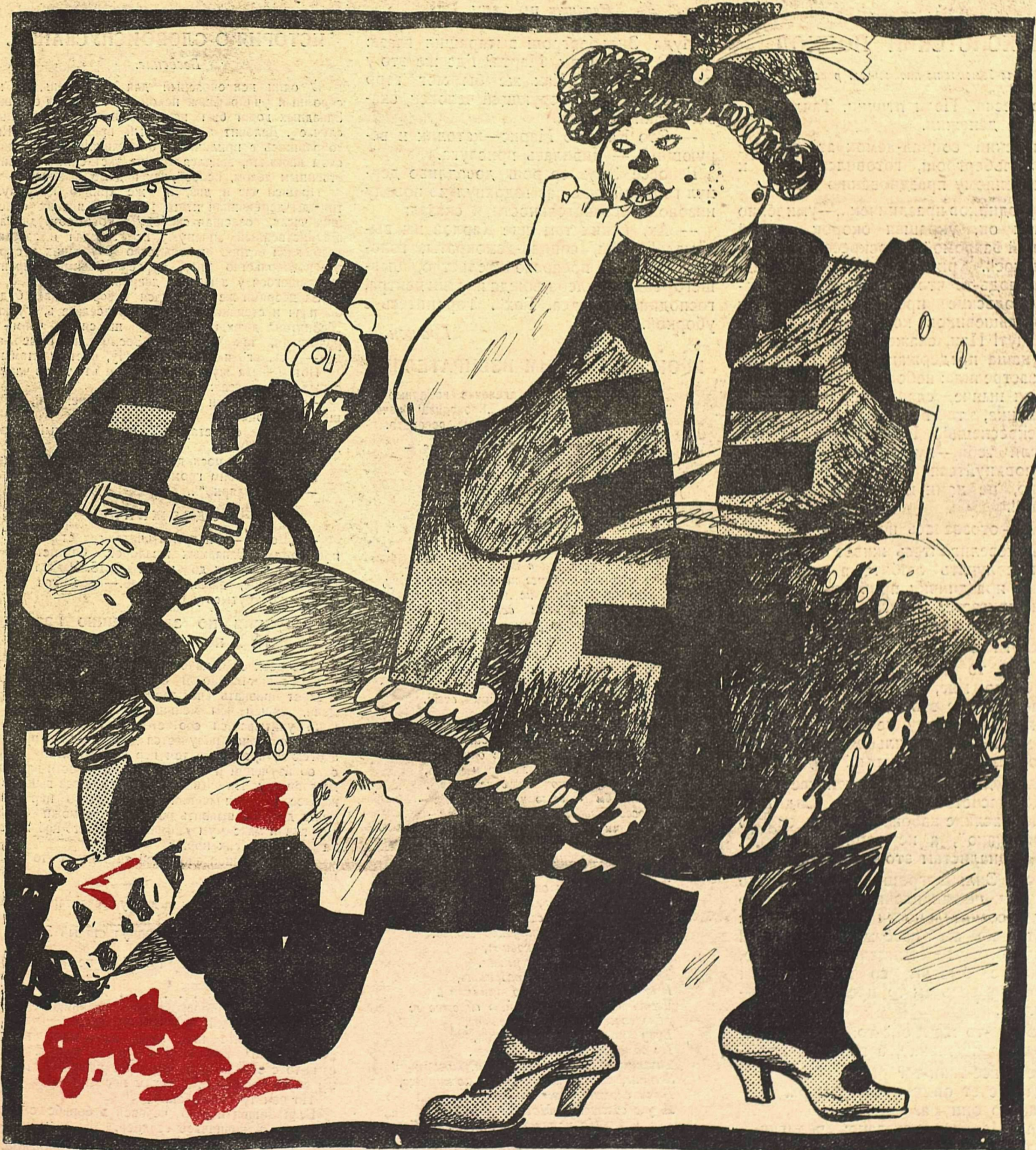
Рис. Ю. Ганфа.

ПОЛЬША:— Какая у этого рабочего кровь красная. Подкрашу губы... Чемберлену понравлюсь... За красоту прибавит.