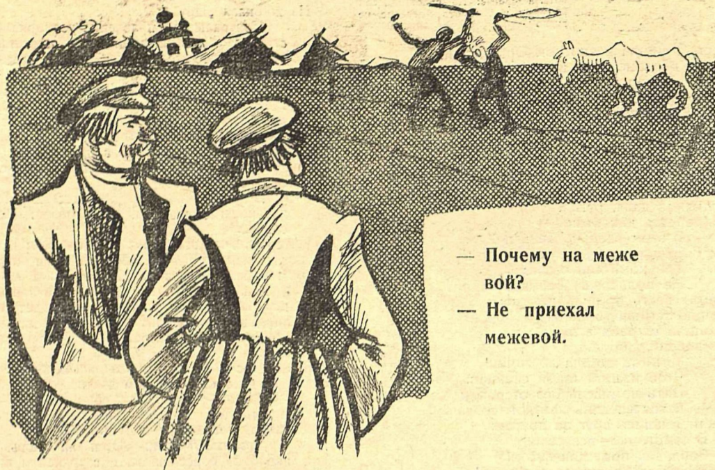
Рис. Ив. Малютина.

— Почему на меже вой? — Не приехал межевой.