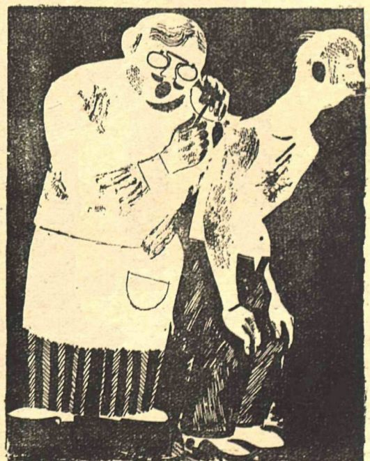
— Алло, центральная? Нас раз'единили...

В районных амбулаториях врачебный персонал перегружен работой.