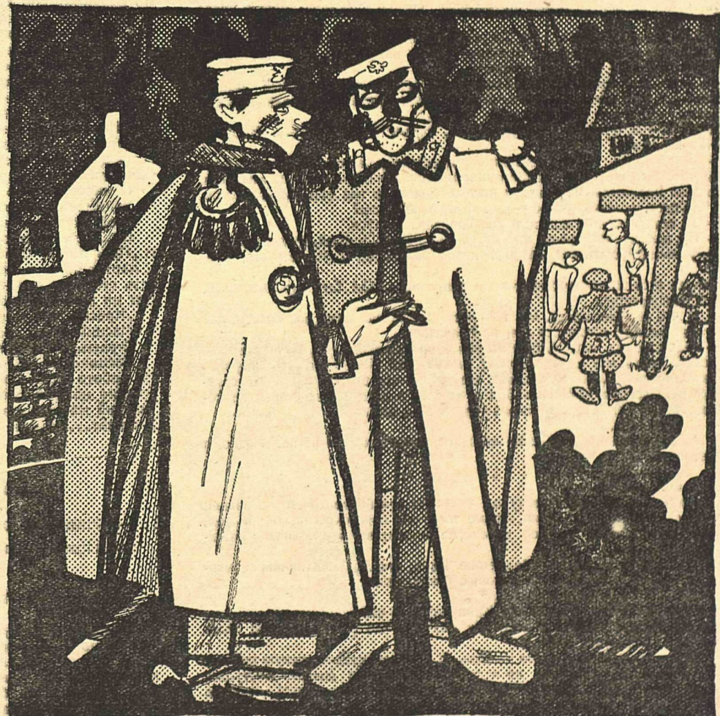
Рис. Ив. Малютина.

— Что это там, проше пана, за шум? — Повстанцев вешают... — Чего же они, чудачки, орут, точно их режут?